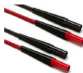
196-3523-00: 加长线 (1.5 米)。