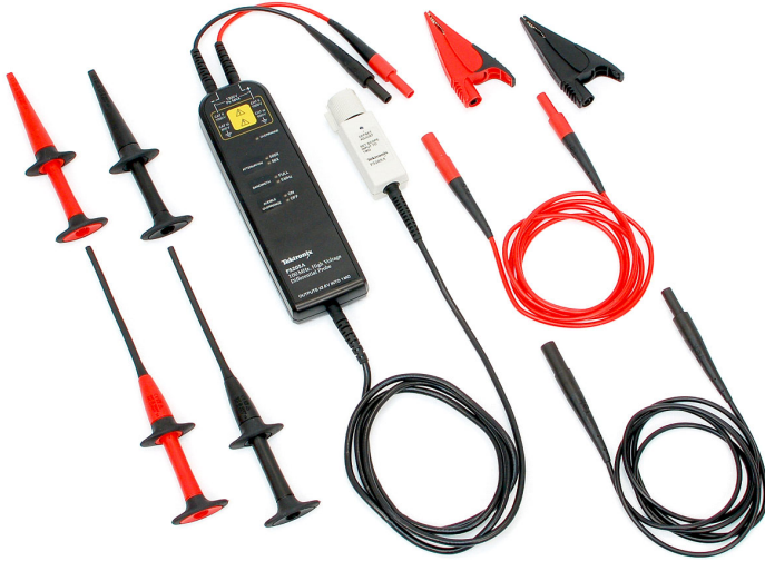
P52xxA 系列探头提供的高压差分测量解决方案适用于任何示波器。