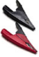
AC285-FL : 鳄鱼夹。